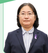
渡瀬 真理子 議員

今回のご提案を今後の市政に活かし、「夢のある、元気のある土浦」の実現に向けて、前進してまいります。ご参加いただいた皆さんが、職場や地域などさまざまな場面で、ますます活躍されることを期待しています。