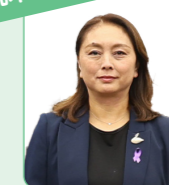
荒木 秀子 議員

継続的な実施のためには財源確保が課題となります。本来は、地域間格差を生じさせないためにも、国が一律に実施すべきと考えますが、国の対策が整うまでは、市で無償化を継続できるように、今後の予算編成で検討してまいります。【安藤市長】