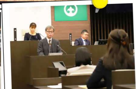
市執行部も真剣に答弁