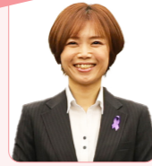
瀧 陽子 議員

道路管理者やボランティアの協力で雑草対策を実施し、通学路については、関係機関と連携して安全点検を行っています。もし、危険箇所を見つけた場合は、危険箇所を報告する「異常通報システム」をご利用ください。【渡辺建設部長】