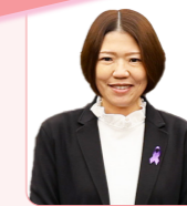
和地 麻貴 議員