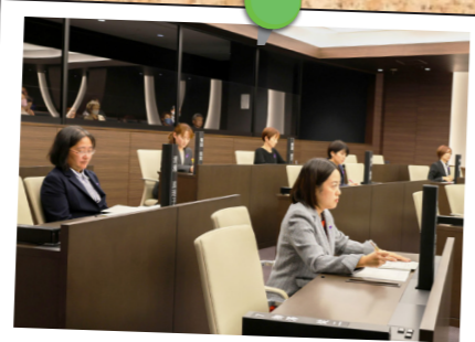
緊張感が伝わります