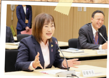
県内唯一の女性首長の安藤市長