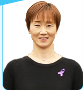
照屋 夏子 議員

第2期土浦市空家等対策計画に基づき各種事業を推進しています。具体的には、空家バンク制度から空き家を購入した方への住宅リフォーム費用の助成、空き家所有者への相談会などを実施しています。今後とも空き家問題解消に努めてまいります。【真家市民生活部長】