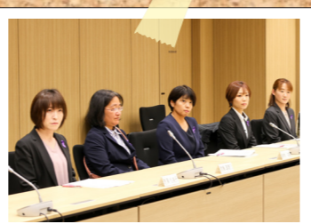
貴重な話が聴けました