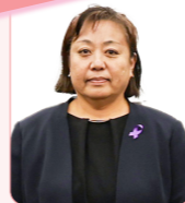
羽成 順子 議員

元気な時から介護予防に取り組むことや、住民主体の通いの場に継続して参加できる地域づくりが必要と考え、生きがい対応型デイサービスなど各種事業を行っています。今後とも各種事業を行っていくとともに、市民の皆さんへのPRも強化していきます。【羽生保健福祉部長】