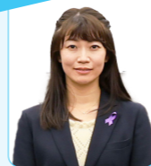
岡田 沙織 議員

一時預かり事業では、非定型的保育と緊急保育を提供しており、ニーズに柔軟に対応しています。また、病児・病後児保育については、さらなる施設整備を、医療機関と連携して検討を進めてまいります。【平井こども未来部長】