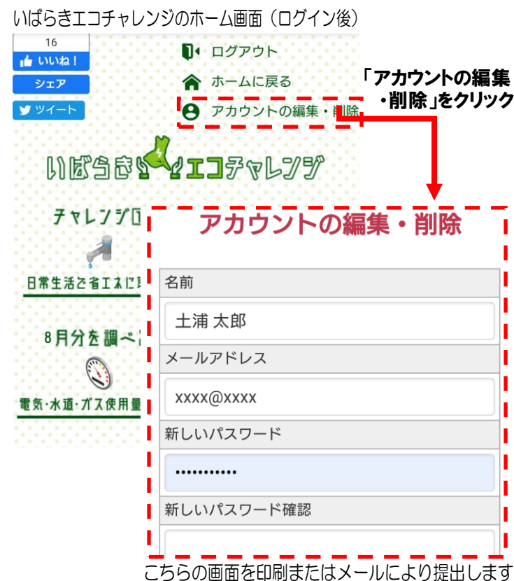
見本図（スマートフォンの場合）

アカウントの編集・削除の画面が確認できるものをご用意ください。（左見本図を参照）