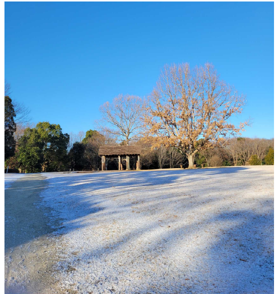
掘立柱建物とクヌギ 令和6年1月14日撮影 広場 クヌギがまだ落葉していません。