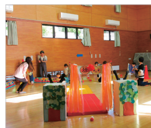
げんきっこ! あつま〜れ