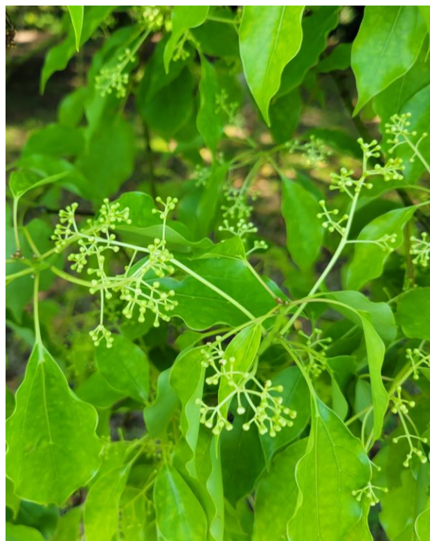
クスノキ 令和6年5月4日撮影 広場