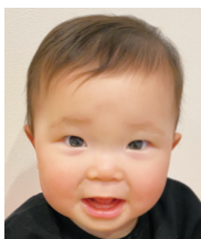
1歳おめでとう♡ これからも元気に 大きくなってね!