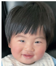
1歳おめでとう♡ これからも笑顔で 元気に育ってね!