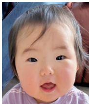
我が家の可愛い 癒やし担当♡ 1歳おめでとう!