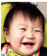
1☆祝 幸せをありがとう! ♡BIGLOVE♡