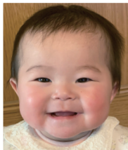
1歳おめでとう☆ すくすく元気に 育ってね!大好き♡