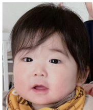
おおきくなって うれしいよ! たくましくぞだってね♪