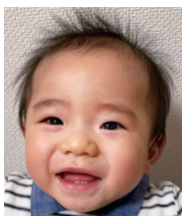
☆祝1歳☆ 幸せな毎日がありが とう!大好きだよ♡