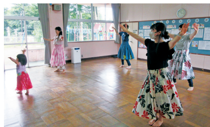
親子でフラダンス