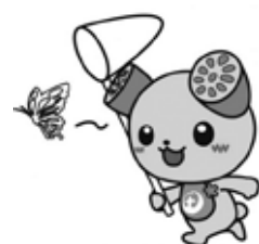
土浦市イメージキャラクター つちまる