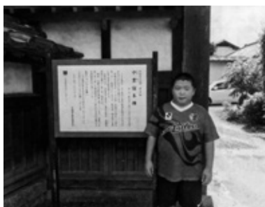
中貫宿本陣の前で