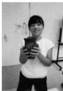
炉の近くにて出土したため表面は黒色をしている弥生式土器（下郷遺跡出土）