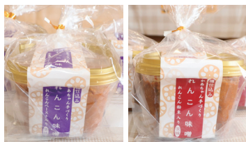
れんこんペースト入り れんこん粉末入り