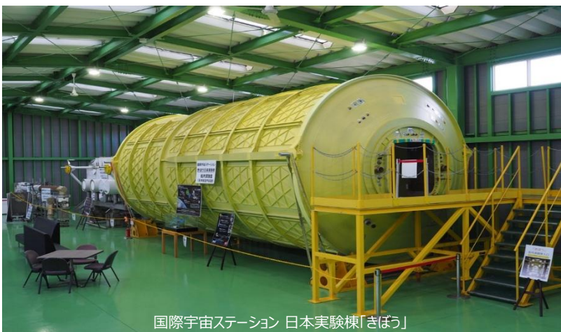
国際宇宙ステーション 日本実験棟「きぼう」