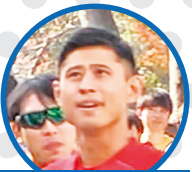
スペシャルサポーター ワタリ119さん