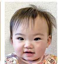
うまれてきてくれて ありがとう! だいすきだよ♡