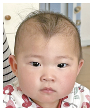
お兄ちゃん大好き みーちゃん! 遅く育ってね