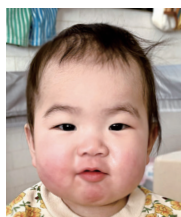
祝♡1歳 笑顔でみんなを癒して くれてありがとう♡