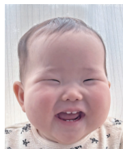
いつもニコニコ♡ 楽しい毎日を ありがとう♡