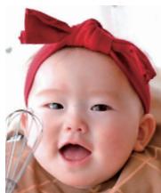
1歳おめでとう! これからたくさん 思い出作ろうね