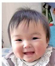
1歳おめでとう! いっぱい笑って 健やかに育ってね!