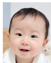
1歳おめでとう! みんなえいとが 大好きだよ♡