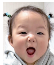
1歳おめでとう♡ これからもすくすく 育ってね!!