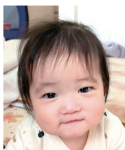
生まれてきてくれて ありがとう! 元気に育ってね!