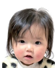
1歳おめでとう♡ 大好きな 甘えん坊お姫様♡