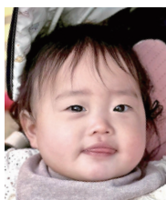
Happy 1st Birthday♡