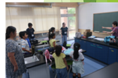
子どもの日本語学習支援プロジェクト