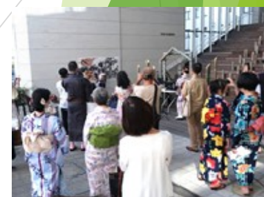
つちうら彩りフェスティバル