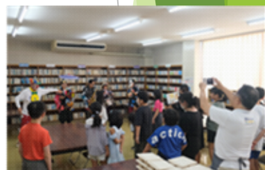
土浦だからの元気プロジェクト