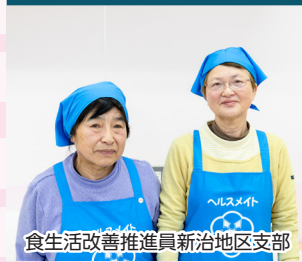
食生活改善推進員新治地区支部