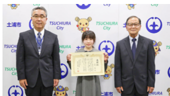
4月3日 表彰式を開催しました