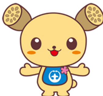
土浦市イメージキャラクター つちまる