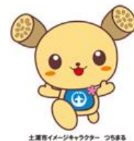
土曜夜イメージキャラクター つらまる