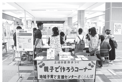
▲昨年の健康まつりの様子