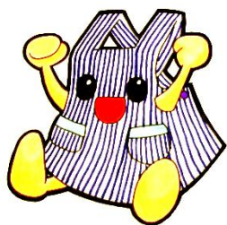
土浦市ヘルスマイトのイメージキャラクター 「えぶろんちゃん」

食生活改善推進員（愛称はヘルスマイト）は、「食」をとおした健康づくりの案内役。「私たちの健康は私たちの手で」をスローガンに、各地区公民館で健康づくりのための料理講習会を開催する等、楽しく活動を行っています。