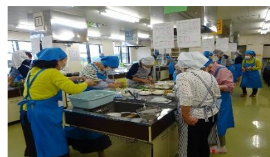
昨年度の活動の様子