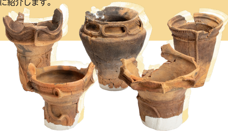
▲神立遺跡から出土した縄文土器