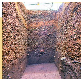
▲上高津貝塚A地点 貝層断面状況

1万年以上続いた縄文時代について、市内の縄文遺跡や、そこから出土した遺物とともに紹介します。