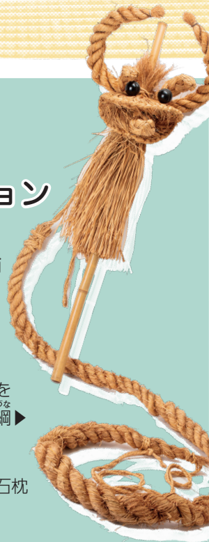
先祖の祖霊を ほんつな 乗せる盆綱▶