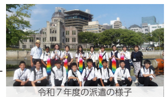
令和7年度の派遣の様子

日程 8月5日(水)～ 16日(日) 場所 土浦市民ギャラリー 問総務課(☎内線2212)