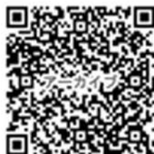
（動画視聴用） 7月中旬公開予定