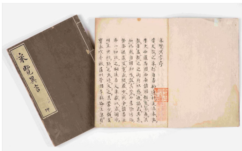
「采覧異言」