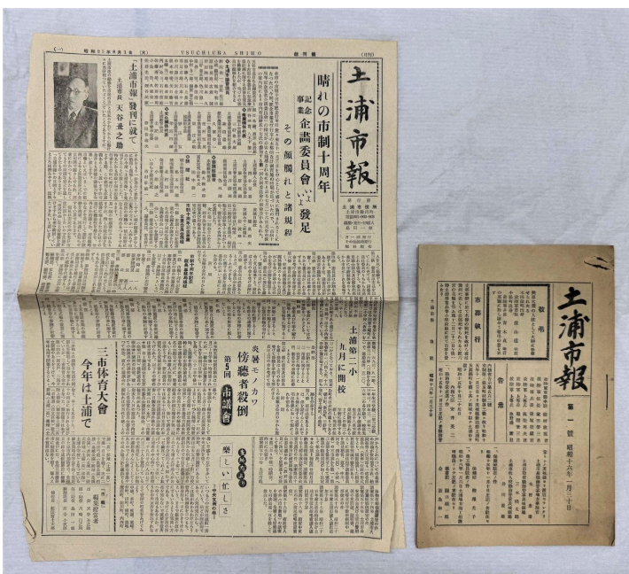
写真左「土浦市報 創刊号」、写真右「土浦市報 第一号」（いずれも当館所蔵）

土浦市の広報紙「広報つちうら」の最新号は No.1406（2026 年 6 月中旬号）です。