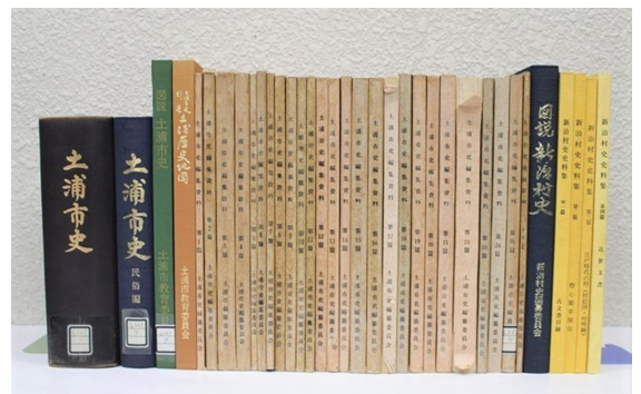
昭和 50 年に刊行された『土浦市史』ほか （当館所蔵）