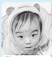
元気に育ってくれて ありがとう! 大きく育ってね!