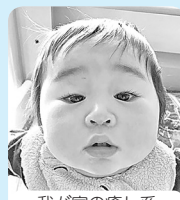
我が家の癒し系 るーちゃん♡すくすく 元気にそだってね