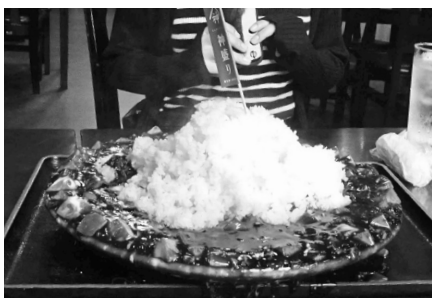
交流人口を増やし神立から元気発進 ~神盛りに挑戦~