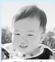
一歳おめでとう! あなたの成長を ずっと見守るよ