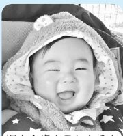
祝★1歳!これからも ママとパパと 沢山遊ぼうね!