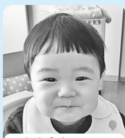
これからもニコニコ 笑顔でみんなに元氣 をありがとう♡