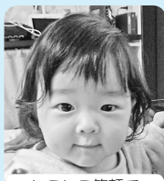
にこにこ笑顔で 元気に育ってね! 大好き♡