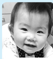
1歳おめでとう♡ お兄ちゃんと仲良く 元気に育ってね!