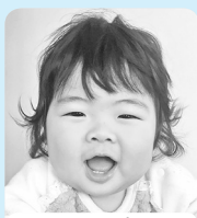
元気いっぱい☆ 笑顔いっぱい♡ 楽しくすごそうね!