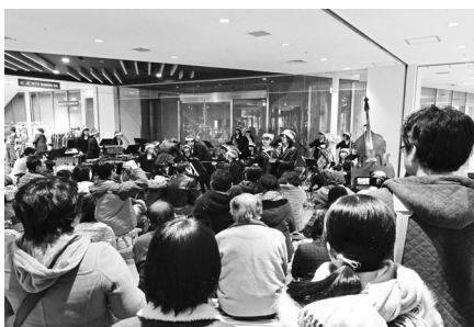
クリスマスもつちうらが好き! ~クリスマスライブの様子~

なお、平成31年度協働のまちづくりファンド事業は、現在募集中です。ふるってご応募ください。