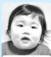
ついに我が家に 男の子♪お姉ちゃん たちに負けるなっ!