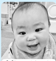
パパとママのところに 生まれてくれて ありがとう♡