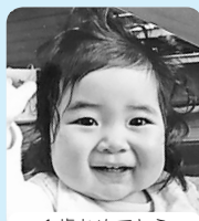
1歳おめでとう いつも笑顔で ありがとう!