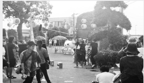
旧斗利出小学校でのロケにつちまるも出演

旧斗利出小学校を夏祭り会場のメインロケ地として使用し、5日間にわたり撮影しました。演者さんのアドリブの応酬が多く、笑いの絶えない撮影現場でした。土浦市イメージキャラクター「つちまる」も出演！全国デビューを果たしました！！