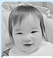
1歳おめでとう! 明るく健やかに笑顔 あふれる人生を☆