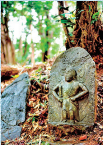
⑦ 常名神社の不動明王 元禄七年