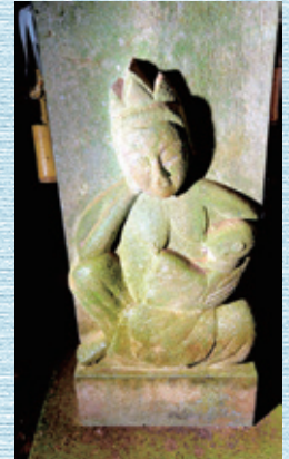
③ 子安観音 嘉永七年 小山崎愛宕神社