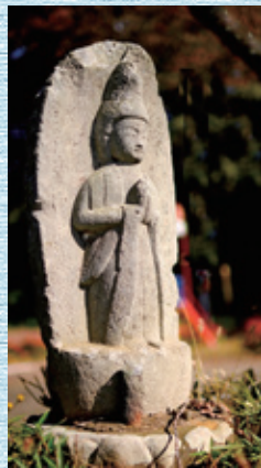
⑤ 常名公民館前の 勢至菩薩 元禄二年