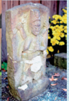
⑩ 如意輪観音、子育て地蔵、馬頭観音 貞享二年 中貫安穩寺