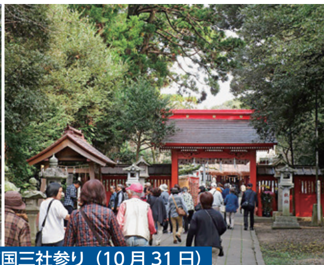
都和地区市民散策会 東国三社参り (10月31日) (上段左：鹿島神宮 上段右：息栖神社 下段左：香取神宮)