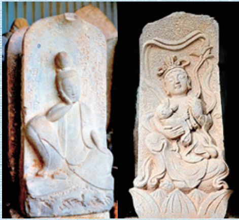
如意輪観音 安永五年