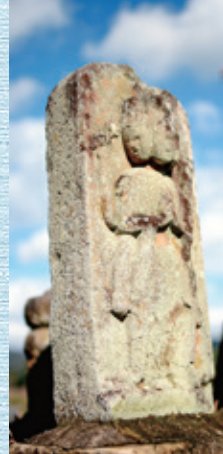
② 馬頭観音と歯痛観音 元禄十三年 今泉法泉寺