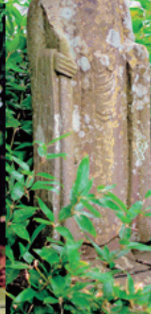
⑥ 聖観音、如意輪観音、子安観音、地蔵菩薩 天文二年 元禄八年 享和三年、安永八年 常名 金山寺