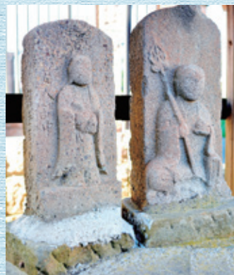
⑨ 常名町新田の子安観音 と地蔵菩薩 享和三年