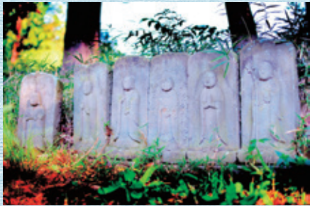
六地藏菩薩 寛政十二年