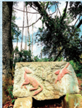
④ 笠師神社の手洗石 慶応二年